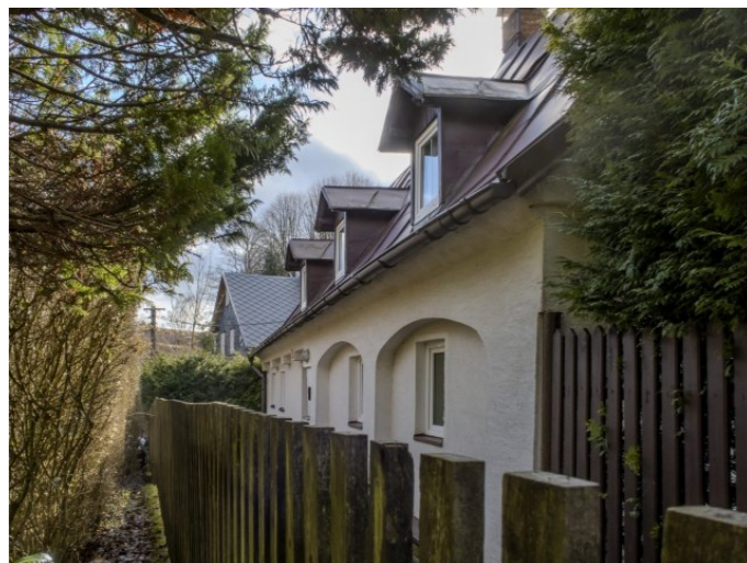
Brtníky č. p. 10 - Pohled na objekt ze severu