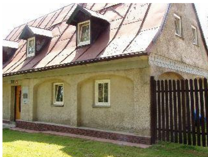
Brtníky č. p. 10 - Pohled na objekt ze severovýchodu