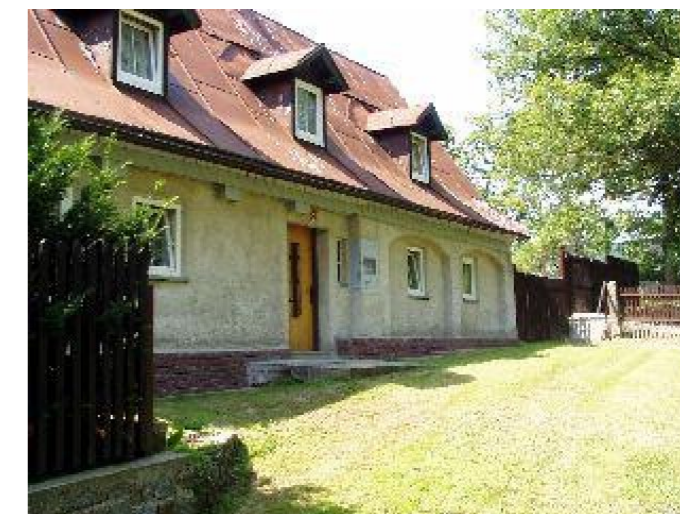
Brtníky č. p. 10 - Pohled na objekt z jihu