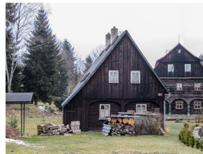
Brtníky č. p. 136 - Pohled na objekt z východu