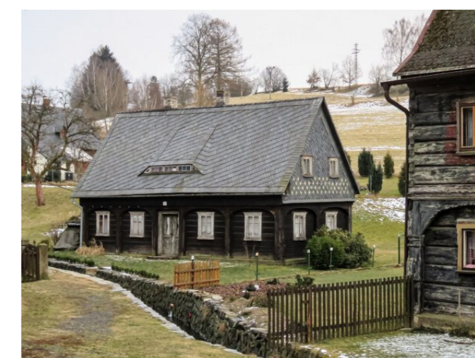
Brtníky č. p. 136 - Pohled na objekt ze severozápadu