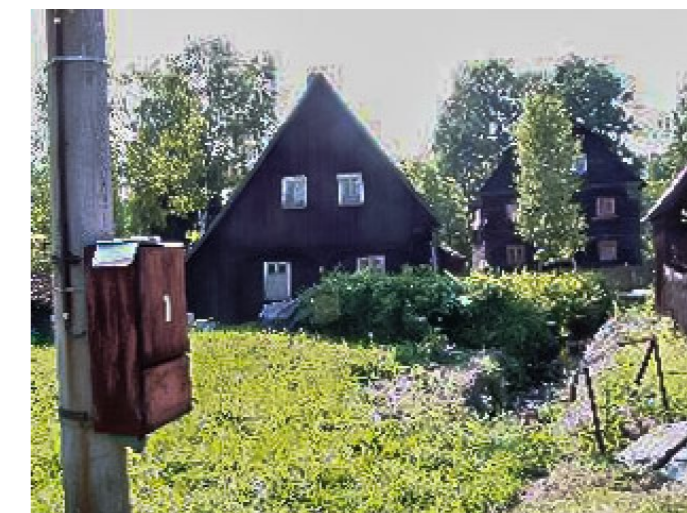
Brtníky č. p. 136 - Pohled na objekt z východu