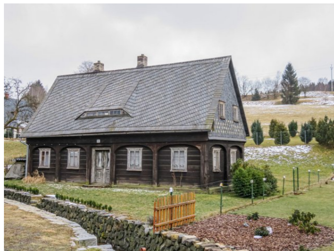
Brtníky č. p. 136 - Pohled na objekt ze severozápadu