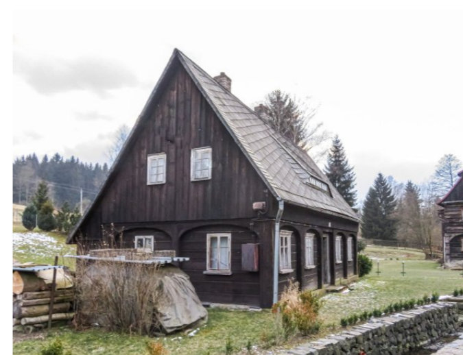
Brtníky č. p. 136 - Pohled na objekt ze severovýchodu