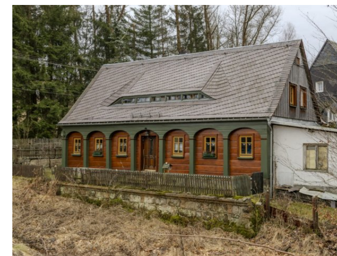
Brtníky č. p. 147 - Pohled na objekt ze severu