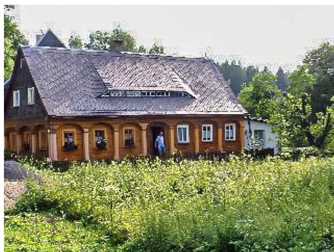
Brtníky č. p. 147 - Pohled na objekt ze severovýchodu