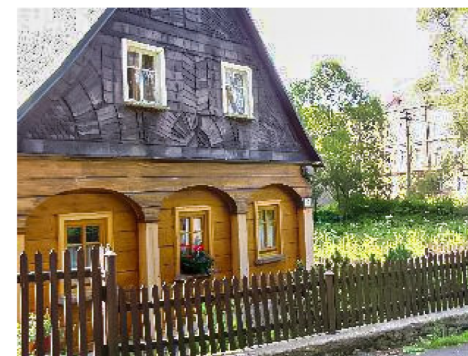
Brtníky č. p. 147 - Pohled na objekt z jihovýchodu