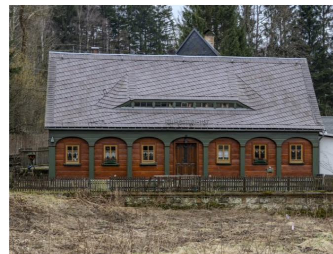
Brtníky č. p. 147 - Pohled na objekt ze severu