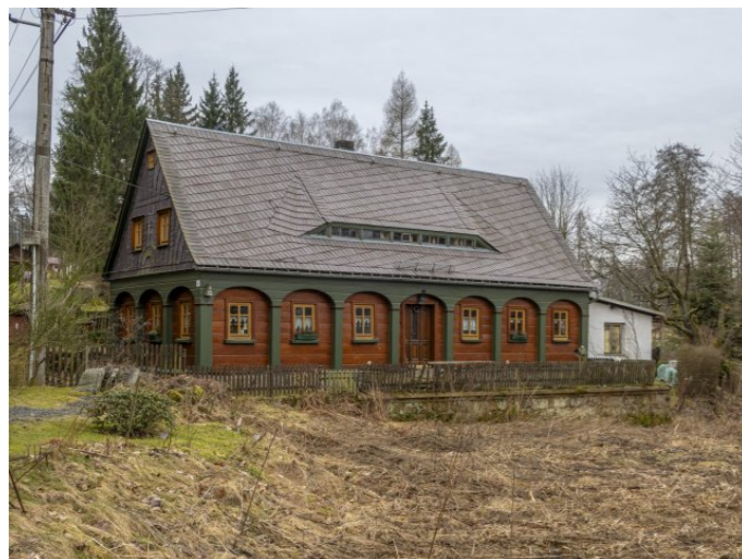
Brtníky č. p. 147 - Pohled na objekt ze severovýchodu