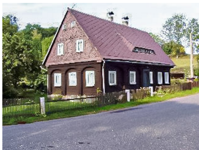
Brtníky č. p. 177 - Pohled na objekt z jihozápadu