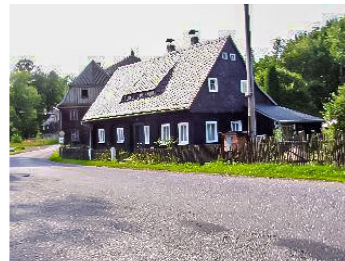
Brtníky č. p. 177 - Pohled na objekt z jihovýchodu (Zdroj: TUR Šluknovsko, 2003)