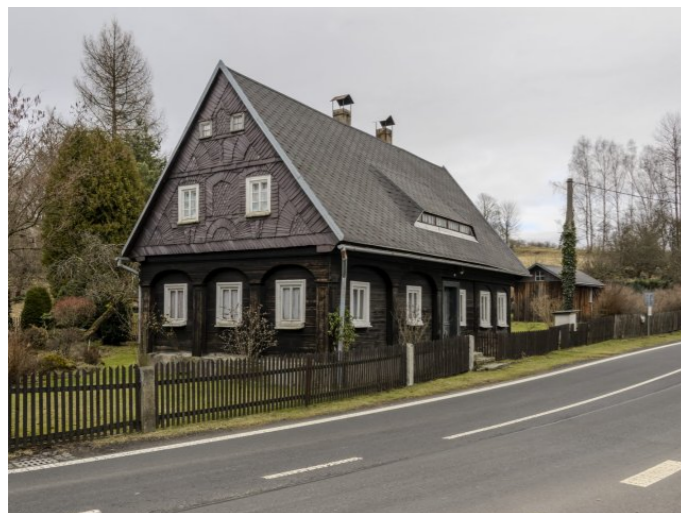
Brtníky č. p. 177 - Pohled na objekt z jihozápadu