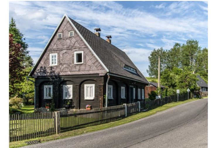
Brtníky č. p. 177 - Pohled na objekt z jihozápadu