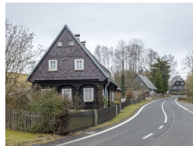
Brtníky č. p. 177 - Pohled na objekt z jihozápadu