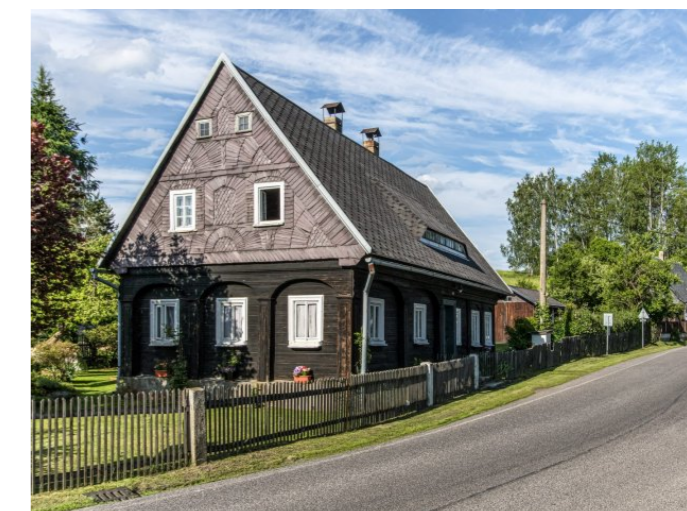
Brtníky č. p. 177 - Pohled na objekt z jihozápadu