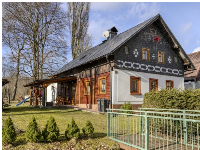
Brtníky č. p. 19 - Pohled na objekt z jihu