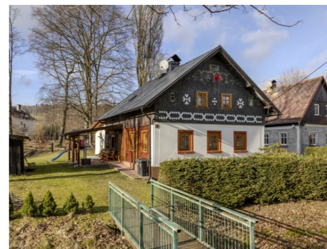
Brtníky č. p. 19 - Pohled na objekt z jihu