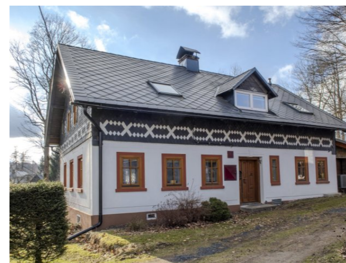
Brtníky č. p. 19 - Pohled na objekt z východu