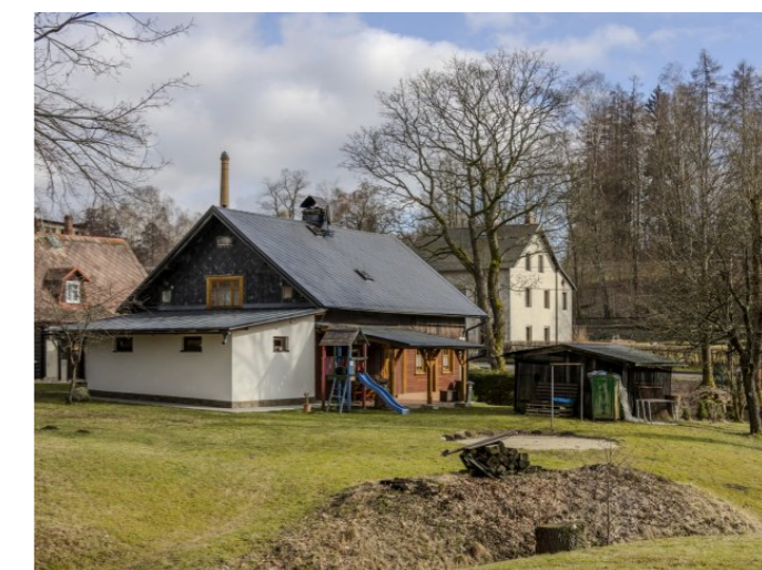
Brtníky č. p. 19 - Pohled na objekt ze západu