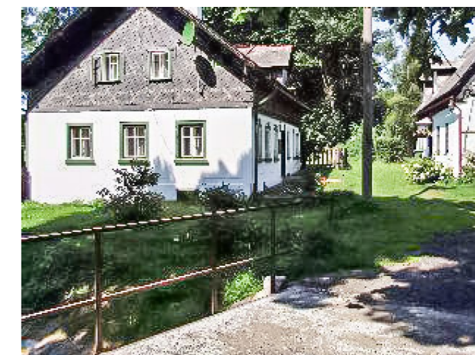
Brtníky č. p. 19 - Pohled na objekt z jihovýchodu