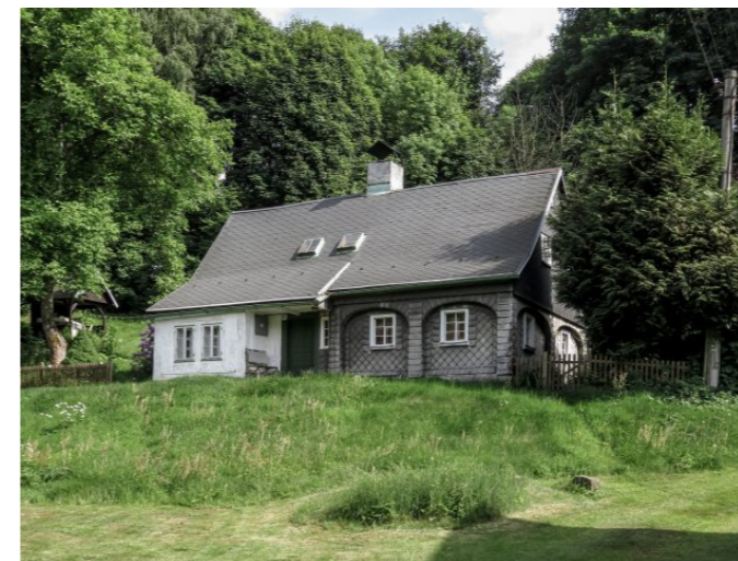
Brtníky č. p. 202 - Pohled na objekt ze severu