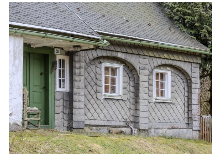
Brtníky č. p. 202 - Pohled na vstupní část