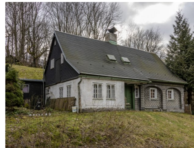
Brtníky č. p. 202 - Pohled na objekt ze severovýchodu