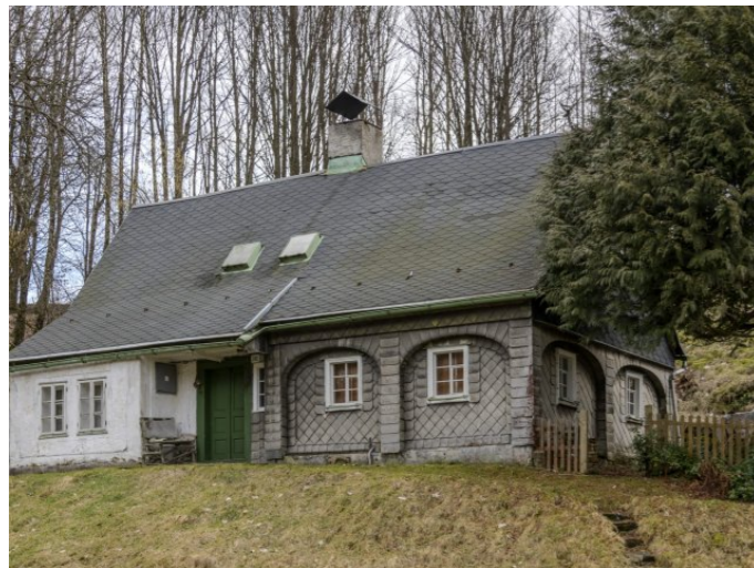
Brtníky č. p. 202 - Pohled na objekt ze severozápadu