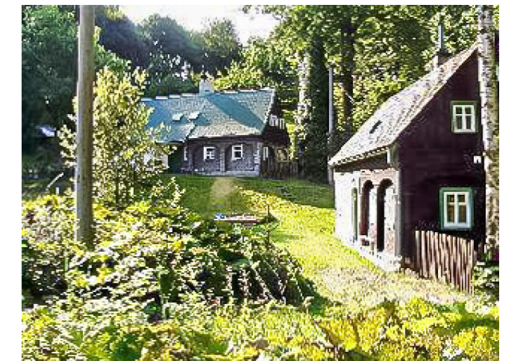
Brtníky č. p. 202 - Pohled na objekt ze severu