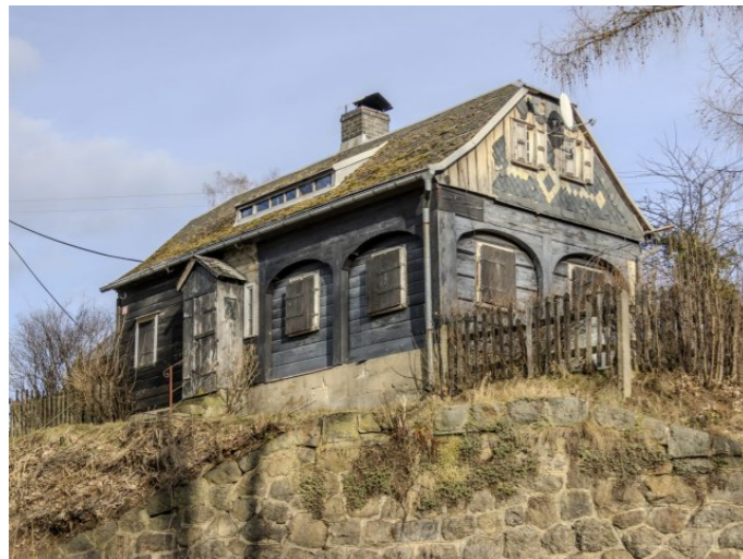
Brtníky č. p. 245 - Pohled na objekt z jihozápadu