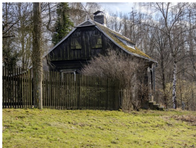
Brtníky č. p. 245 - Pohled na objekt ze severu