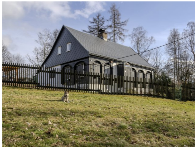
Brtníky č. p. 246 - Pohled na objekt ze severozápadu