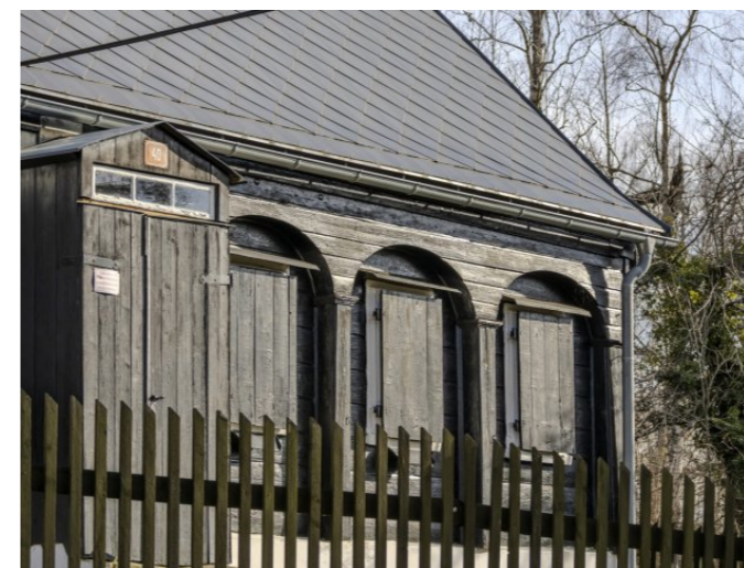
Brtníky č. p. 246 - Detail podstávkového pole s okenními otvory