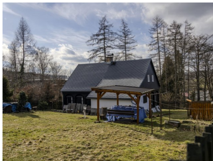
Brtníky č. p. 246 - Pohled na objekt z východu