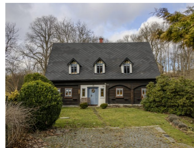
Brtníky č. p. 48 - Pohled na objekt z jihu