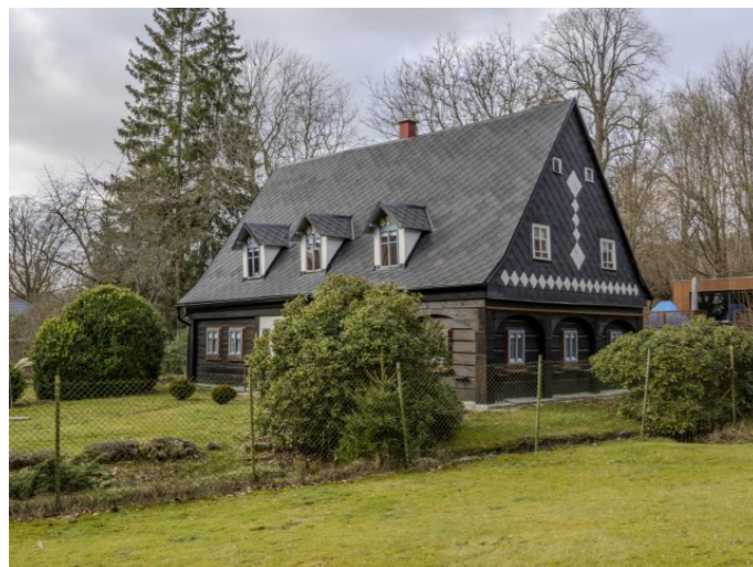
Brtníky č. p. 48 - Pohled na objekt z východu