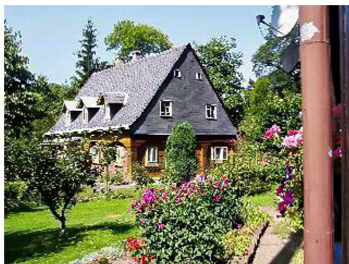
Brtníky č. p. 48 - Pohled na objekt z východu