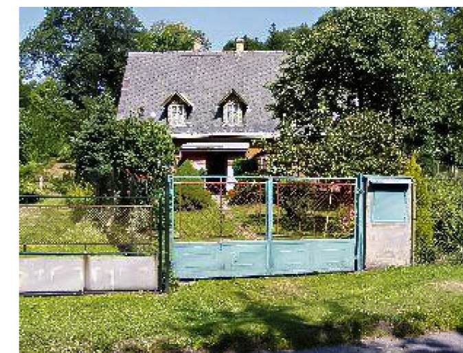
Brtníky č. p. 48 - Pohled na objekt z jihu