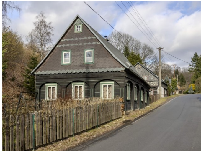
Brtníky č. p. 53 - Pohled na objekt z jihu