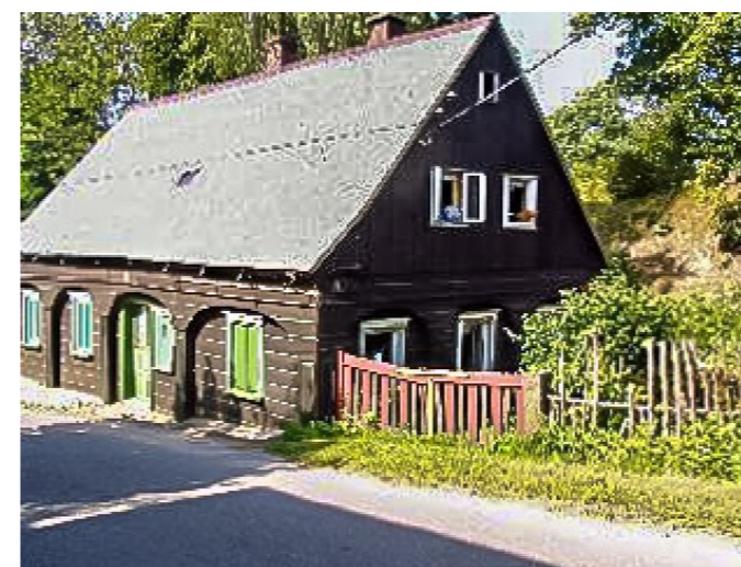
Brtníky č. p. 53 - Pohled na objekt ze severovýchodu