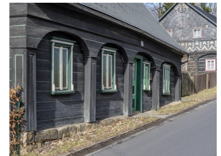
Brtníky č. p. 53 - Pohled na podstávkovou část