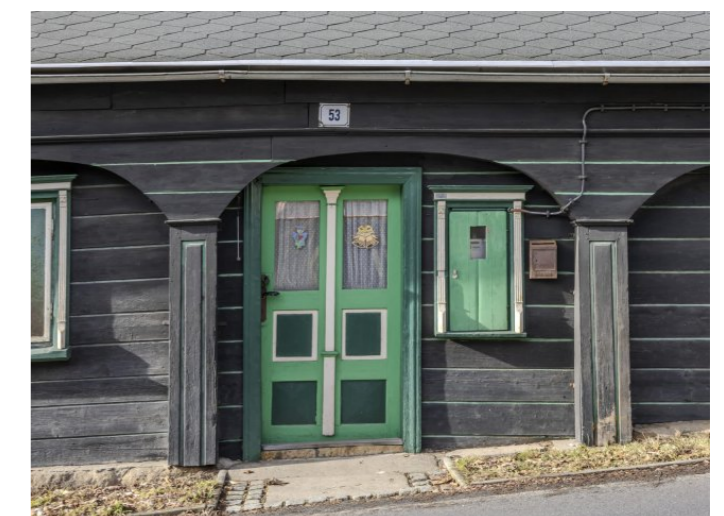
Brtníky č. p. 53 - Detail vstupního portálu