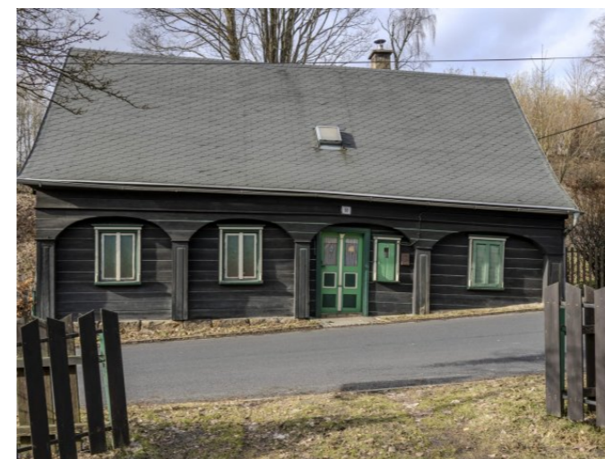
Brtníky č. p. 53 - Pohled na objekt z jihovýchodu