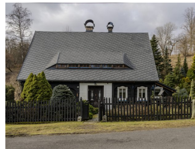
Brtníky č. p. 55 - Pohled na vstupní část