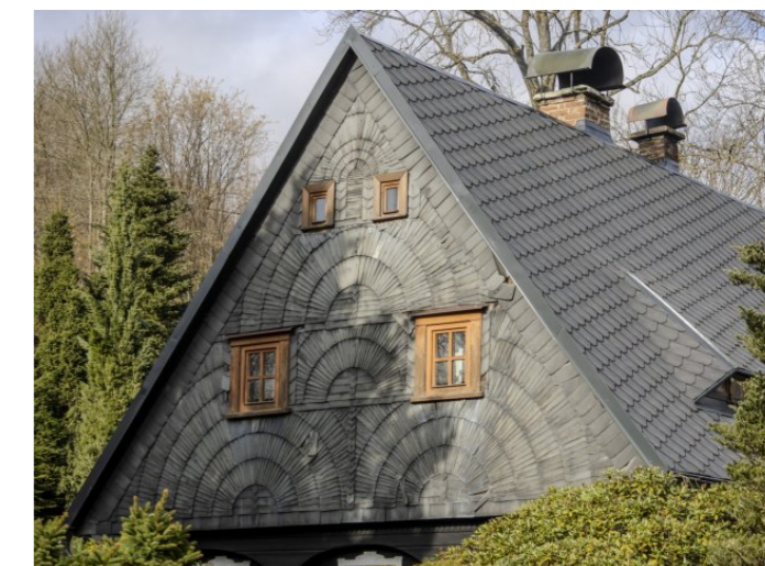
Brtníky č. p. 55 - Detail průčelí