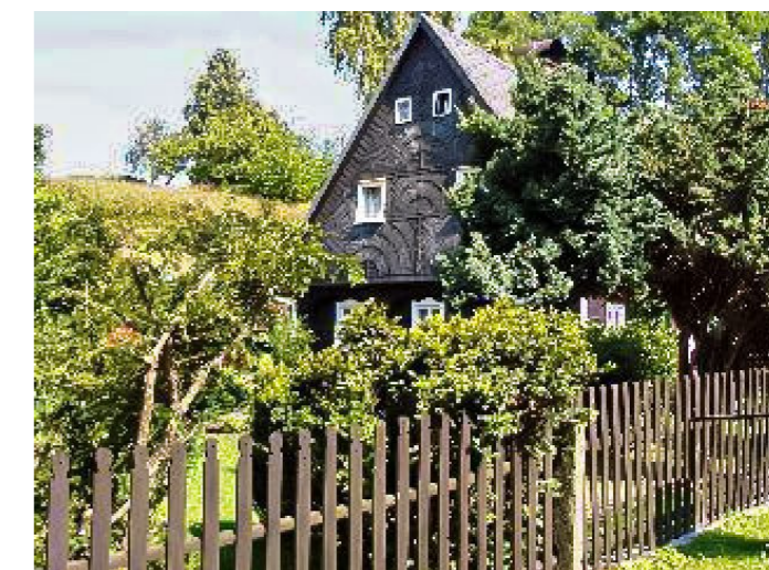
Brtníky č. p. 55 - Pohled na objekt z jihu