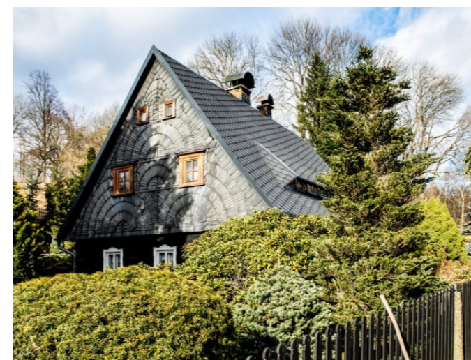
Brtníky č. p. 55 - Pohled na objekt z jihu (Zdroj: S. Šulcová, 2024)