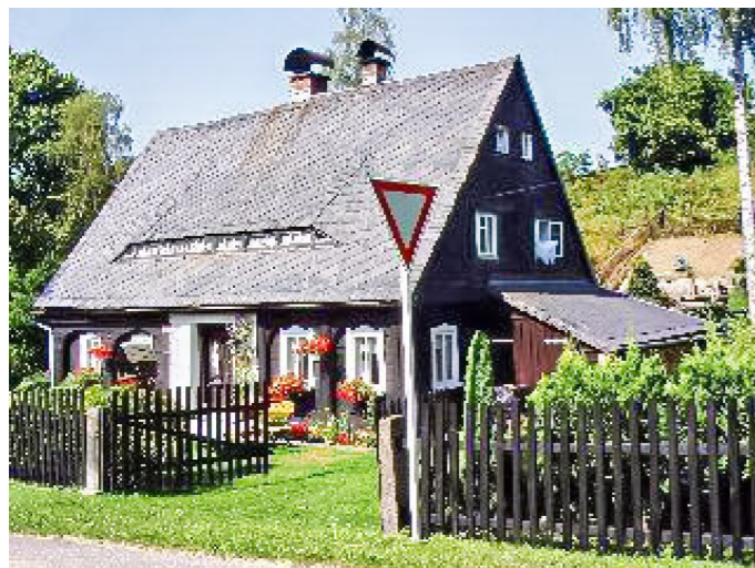
Brtníky č. p. 55 - Pohled na objekt z východu