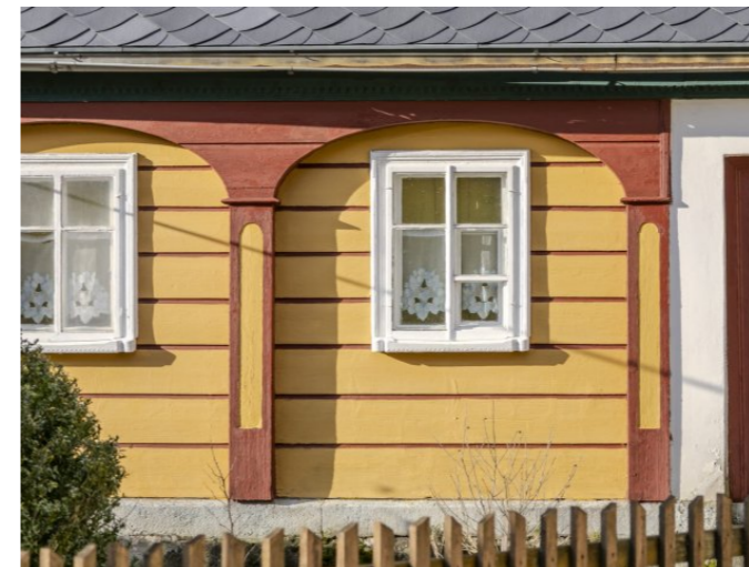
Brtníky č. ev. 21 - Detail podstávkového pole s okenními otvory