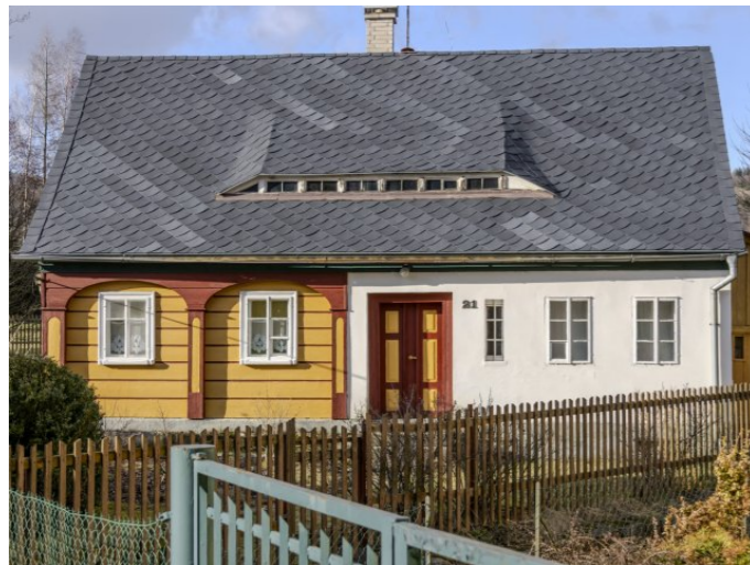
Brtníky č. ev. 21 - Pohled na objekt z jihovýchodu