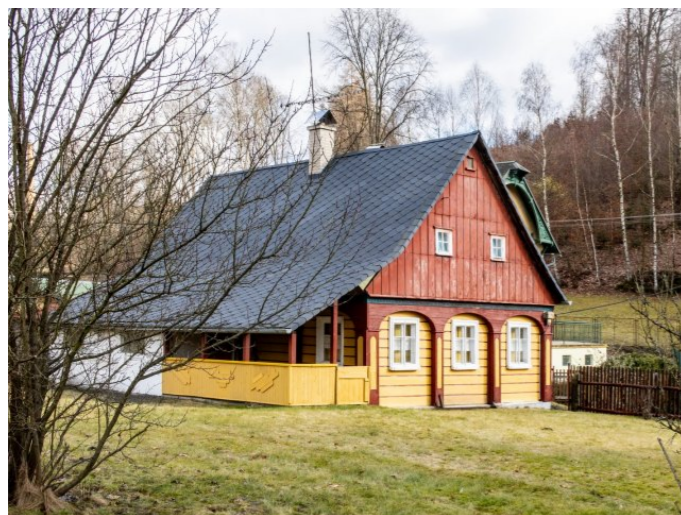
Brtníky č. ev. 21 - Pohled na objekt ze západu