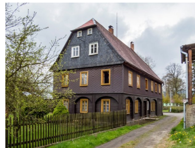
Mikulášovice č. p. 24 - Pohled na objekt z východu