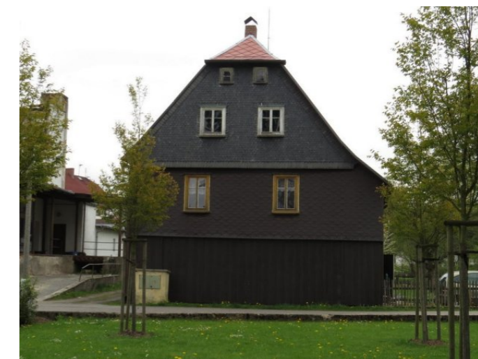
Mikulášovice č. p. 24 - Pohled na objekt ze západu