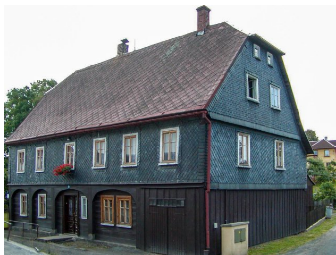
Mikulášovice č. p. 24 - Pohled na objekt ze severozápadu