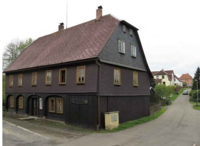
Mikulášovice č. p. 24 - Pohled na objekt ze severozápadu