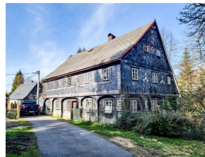
Mikulášovice č. p. 311 - Pohled na objekt z jihu