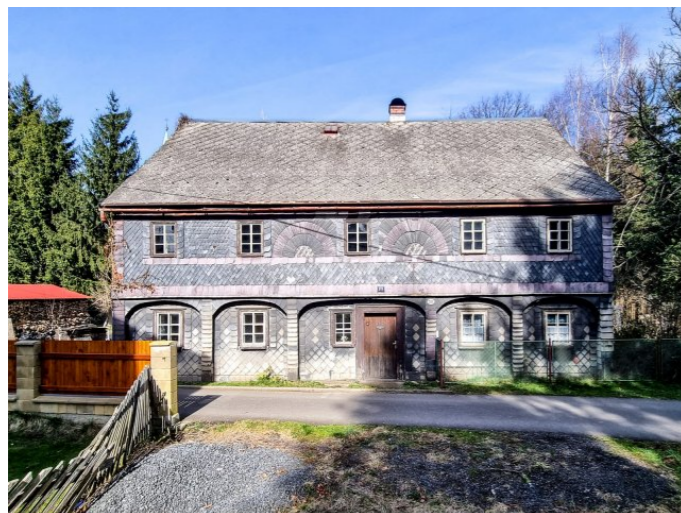
Mikulášovice č. p. 311 - Pohled na vstupní průčelí z jihozápadu