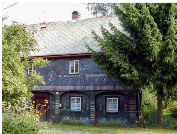
Mikulášovice č. p. 311 - Pohled na objekt z jihu