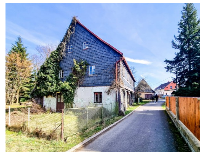
Mikulášovice č. p. 311 - Pohled na objekt ze západu