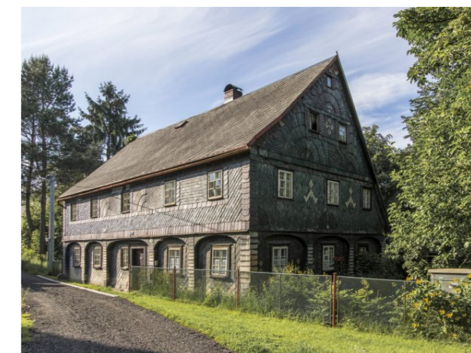
Mikulášovice č. p. 311 - Pohled na objekt z jihu