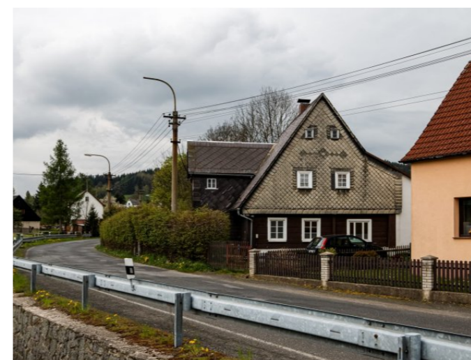
Mikulášovice č. p. 405 - Pohled na objekt ze severozápadu