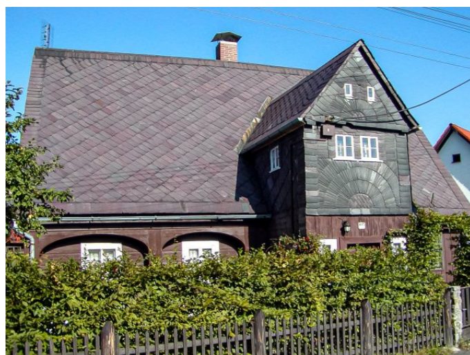
Mikulášovice č. p. 405 - Pohled na objekt z východu