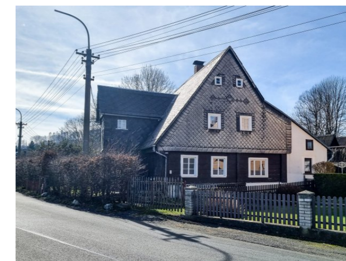
Mikulášovice č. p. 405 - Pohled na objekt ze severovýchodu