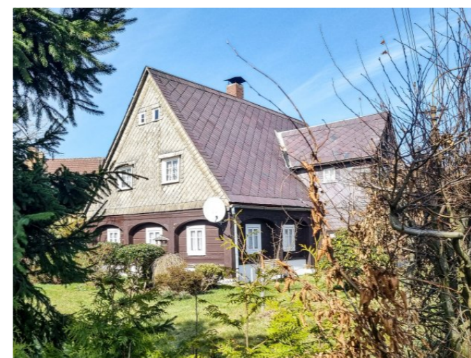
Mikulášovice č. p. 405 - Pohled na objekt z jihu