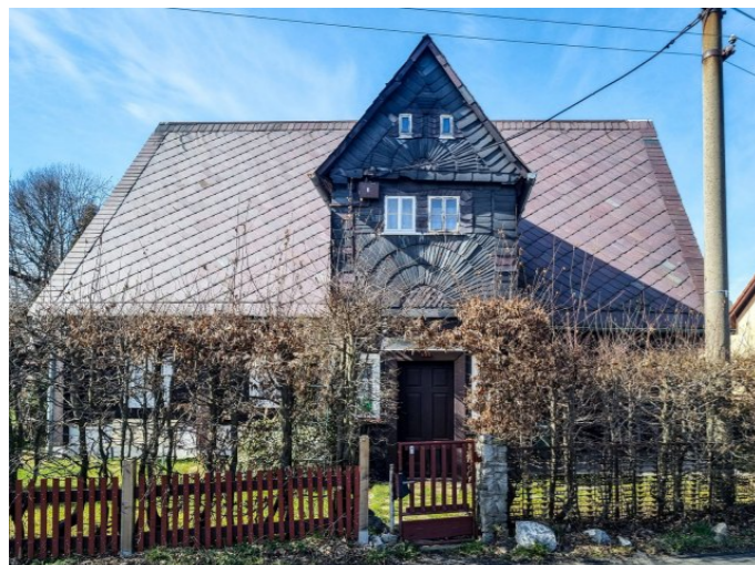
Mikulášovice č. p. 405 - Pohled na objekt z východu