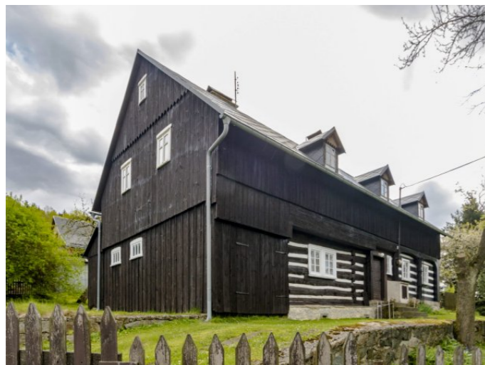
Mikulášovice č. p. 449 - Pohled na objekt z jihozápadu