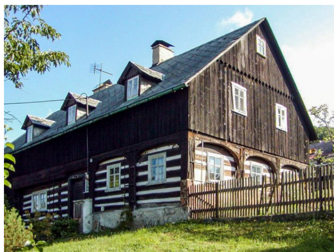
Mikulášovice č. p. 449 - Pohled na objekt z jihu