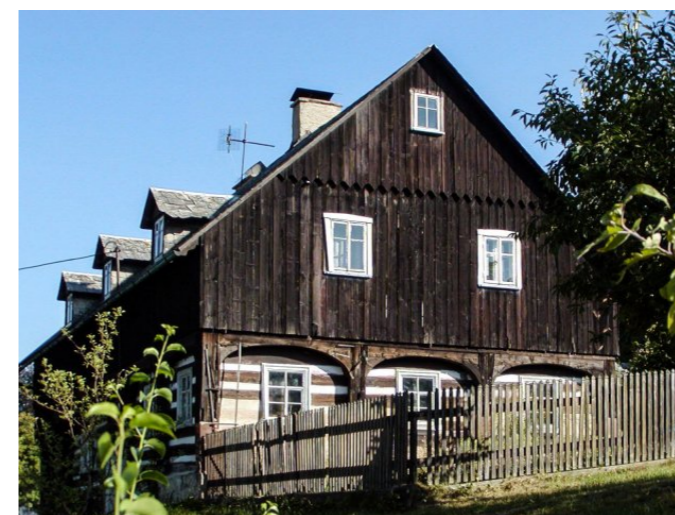
Mikulášovice č. p. 449 - Pohled na objekt z jihovýchodu