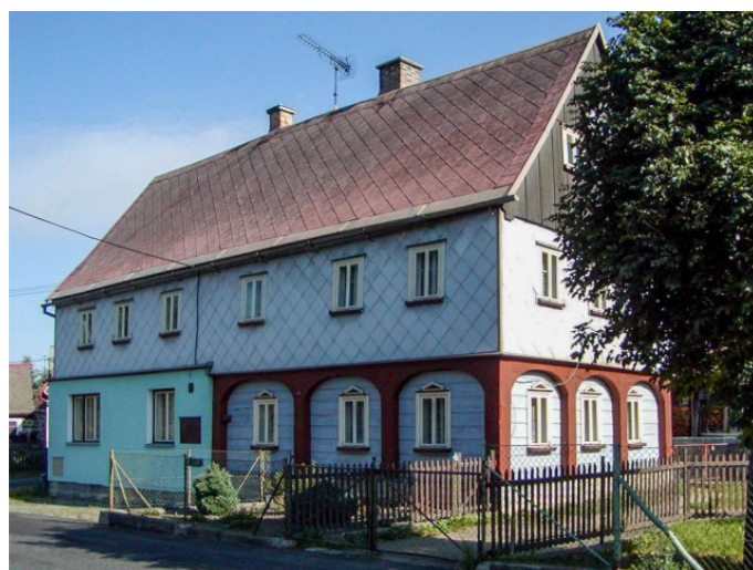
Mikulášovice č. p. 455 - Pohled na objekt z jihu