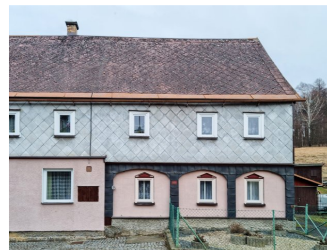
Mikulášovice č. p. 455 - Pohled na objekt z jihozápadu