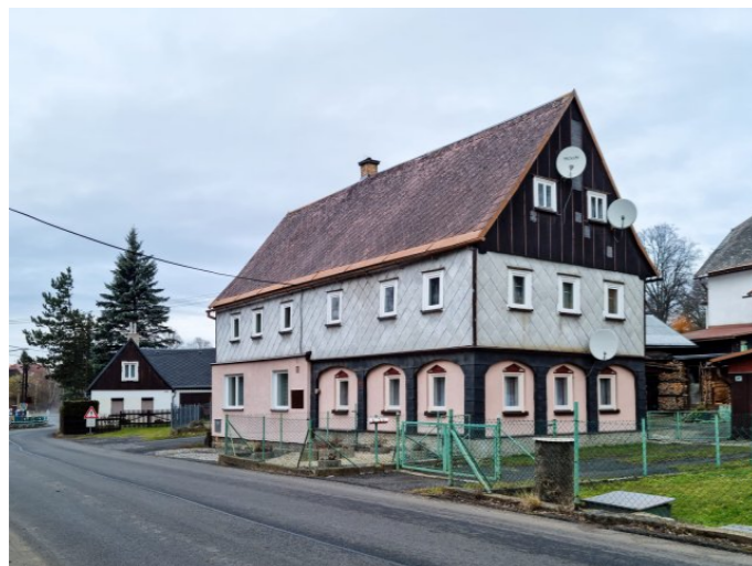
Mikulášovice č. p. 455 - Pohled na objekt z jihu