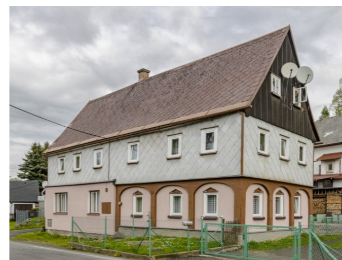
Mikulášovice č. p. 455 - Pohled na objekt z jihovýchodu