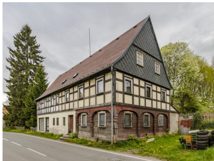
Mikulášovice č. p. 568 - Pohled na objekt z jihu