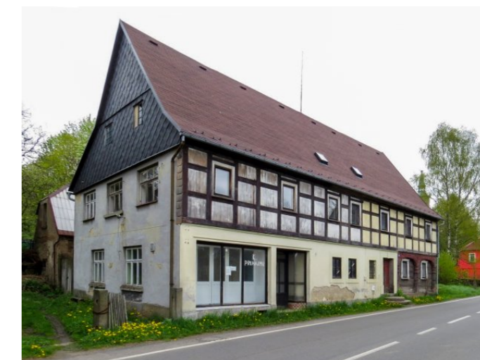
Mikulášovice č. p. 568 - Pohled na objekt z jihu