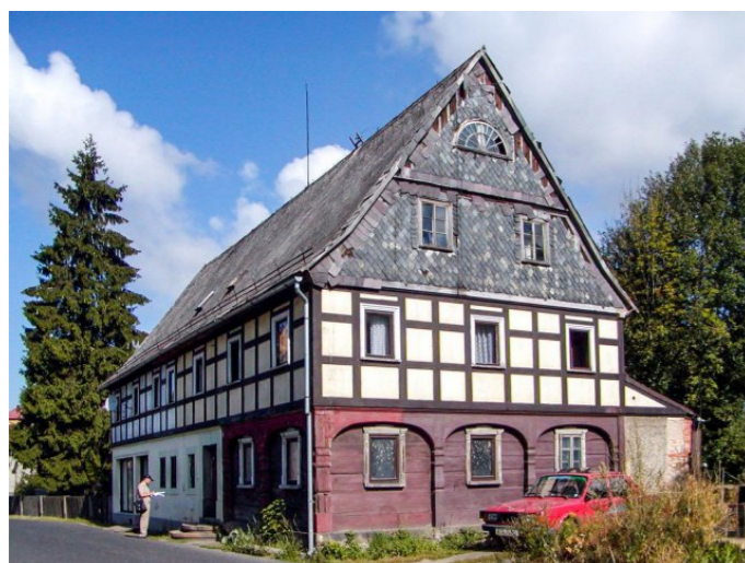
Mikulášovice č. p. 568 - Pohled na objekt z jihu