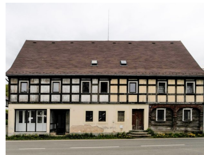
Mikulášovice č. p. 568 - Pohled na objekt ze západu