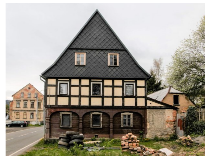
Mikulášovice č. p. 568 - Pohled na objekt z jihovýchodu