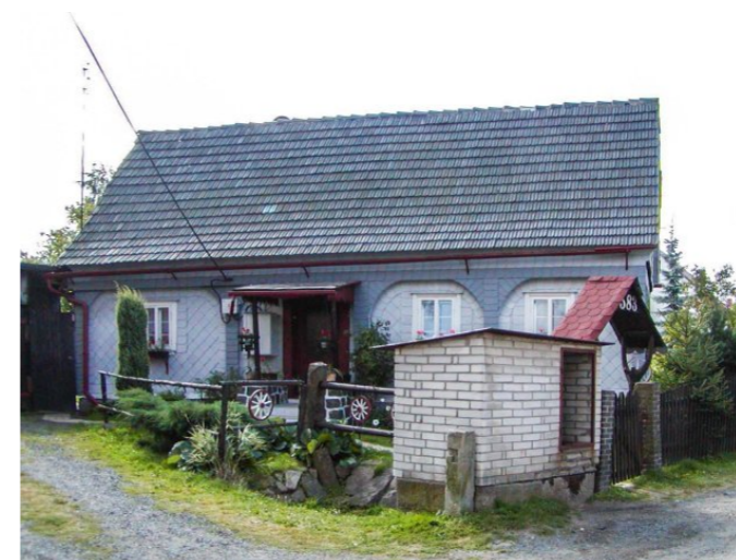
Mikulášovice č. p. 583 - Pohled na objekt ze severu