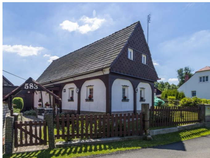
Mikulášovice č. p. 583 - Pohled na objekt ze severozápadu