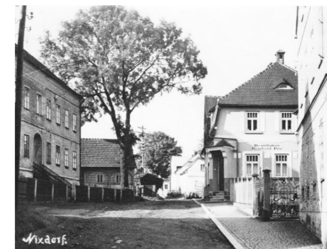
Mikulášovice č. p. 583 - Historický pohled ze severu