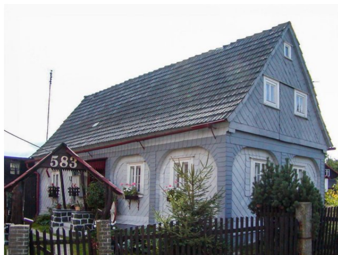
Mikulášovice č. p. 583 - Pohled na objekt ze severozápadu