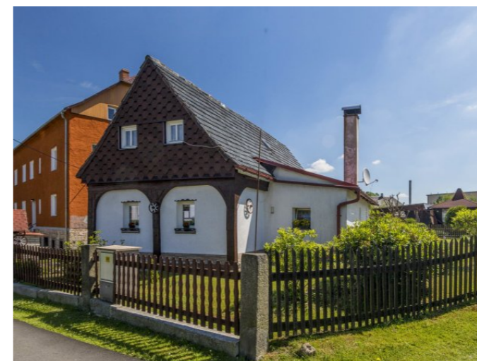
Mikulášovice č. p. 583 - Pohled na objekt z jihu-západu