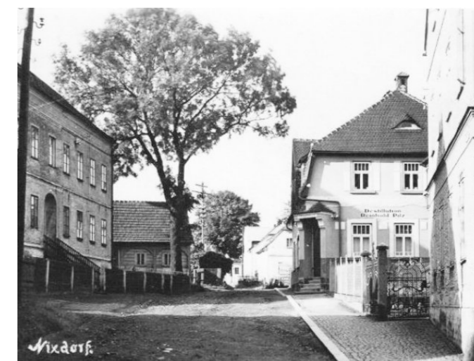
Mikulášovice č. p. 583 - Historický pohled ze severu