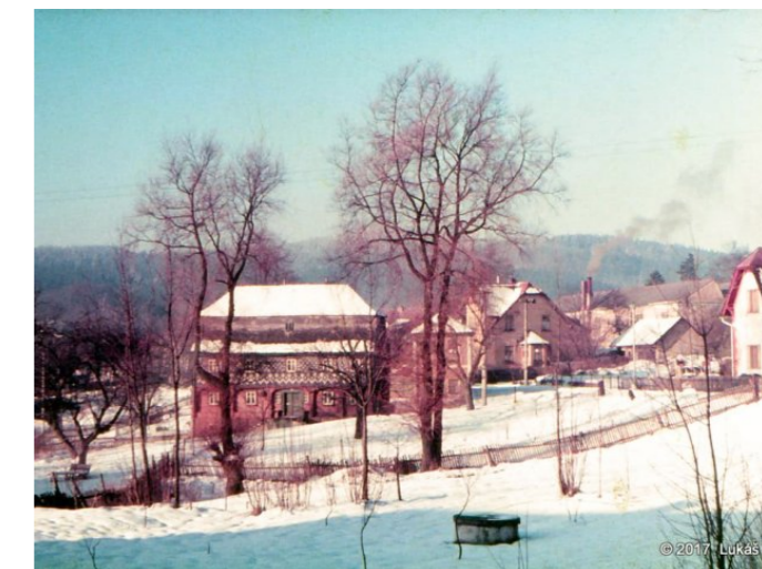
Mikulášovice č. p. 588 - Pohled na objekt z východu