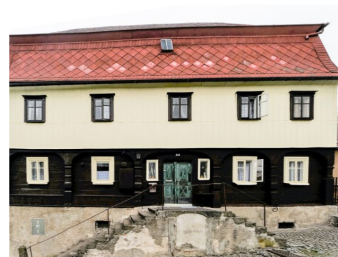
Mikulášovice č. p. 588 - Pohled na objekt z východu