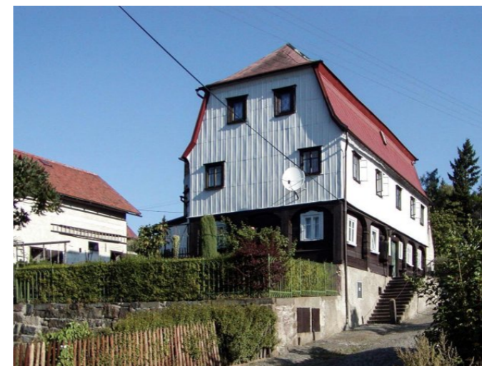
Mikulášovice č. p. 588 - Pohled na objekt z jihovýchodu