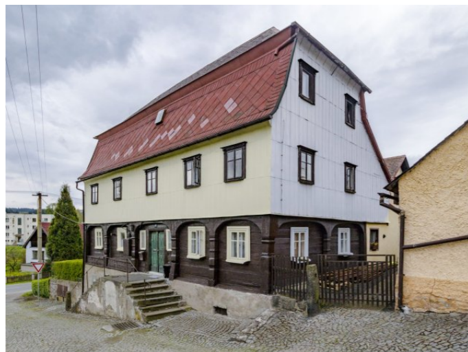
Mikulášovice č. p. 588 - Pohled na objekt ze severovýchodu