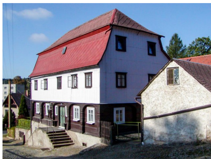
Mikulášovice č. p. 588 - Pohled na objekt ze severovýchodu