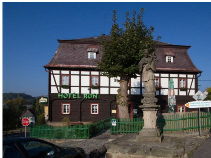
Mikulášovice č. p. 5 - Pohled na objekt z východu