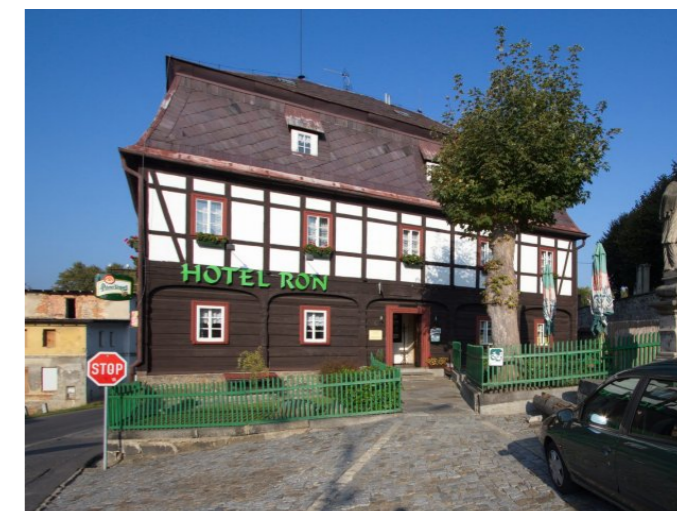
Mikulášovice č. p. 5 - Pohled na objekt z východu