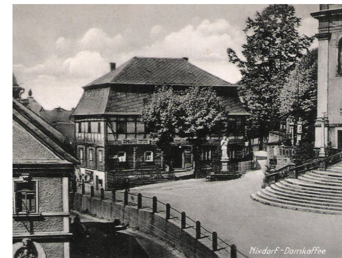
Mikulášovice č. p. 5 - Historický pohled