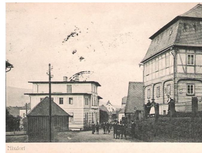
Mikulášovice č. p. 5 - Historický pohled 1906