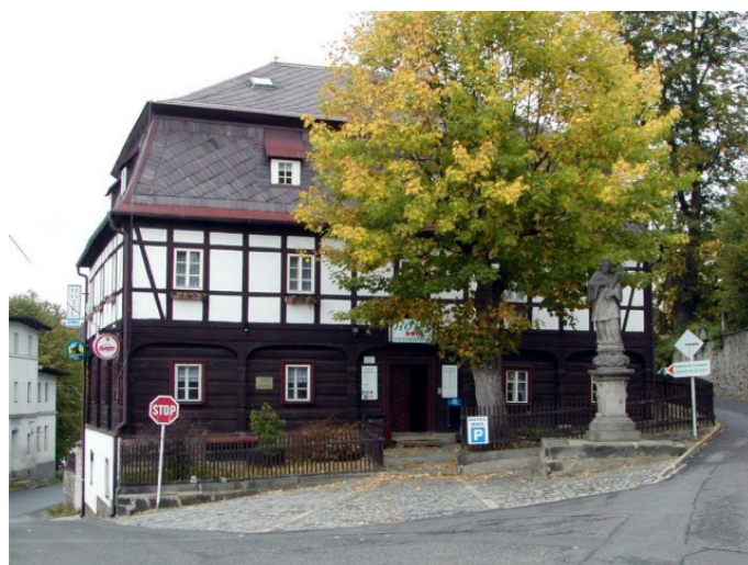
Mikulášovice č. p. 5 - Pohled na objekt z východu