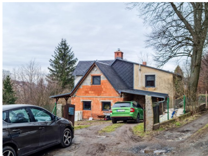
Mikulášovice č. p. 600 - Pohled na objekt z jihu