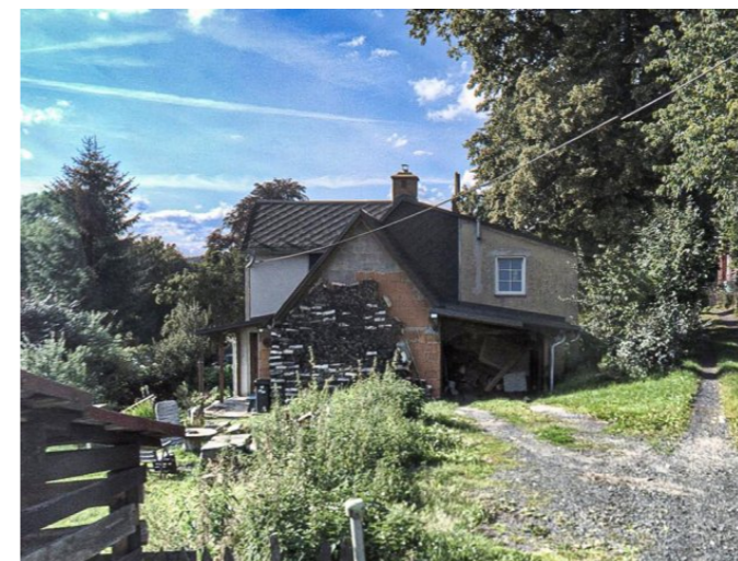
Mikulášovice č. p. 600 - Pohled na objekt z jihu