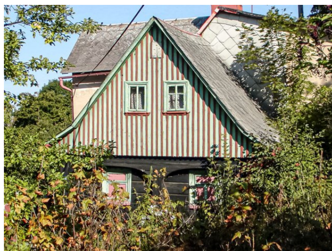
Mikulášovice č. p. 600 - Pohled na objekt z jihu