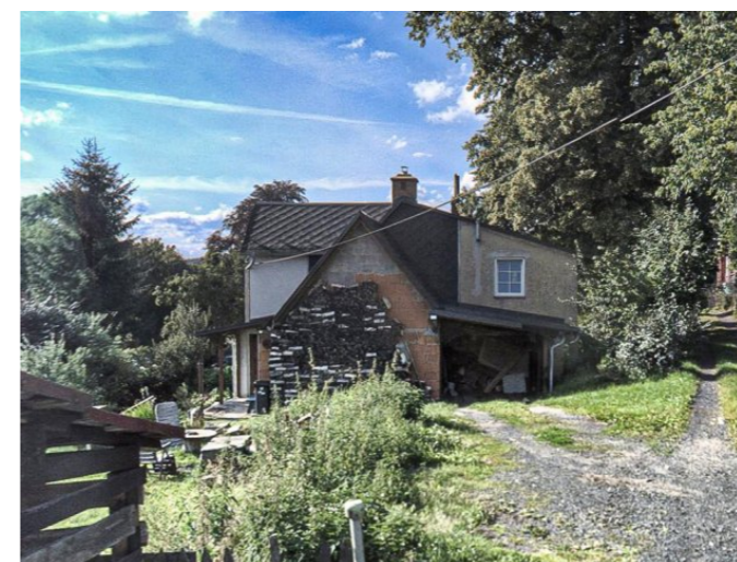
Mikulášovice č. p. 600 - Pohled na objekt z jihu (Zdroj: Panorama - MAPY.CZ. (2016). [Mikulášovice 600]. Online. Seznam.cz, 2024. Dostupné z: https://mapy.cz/zakladni?pano=1&q=mikul%C3%A1%C5%A1ovice%20600 [citováno 2024-03-20], 2016)