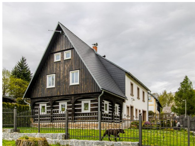
Mikulášovičky č. p. 14 - Pohled na objekt z jihovýchodu