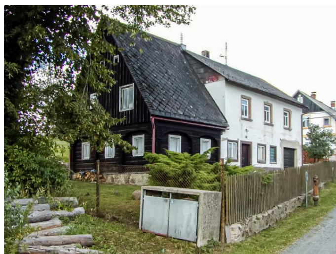
Mikulášovičky č. p. 14 - Pohled na objekt z jihovýchodu