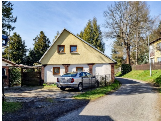
Vilémov č. p. 9 - Pohled na objekt z východu