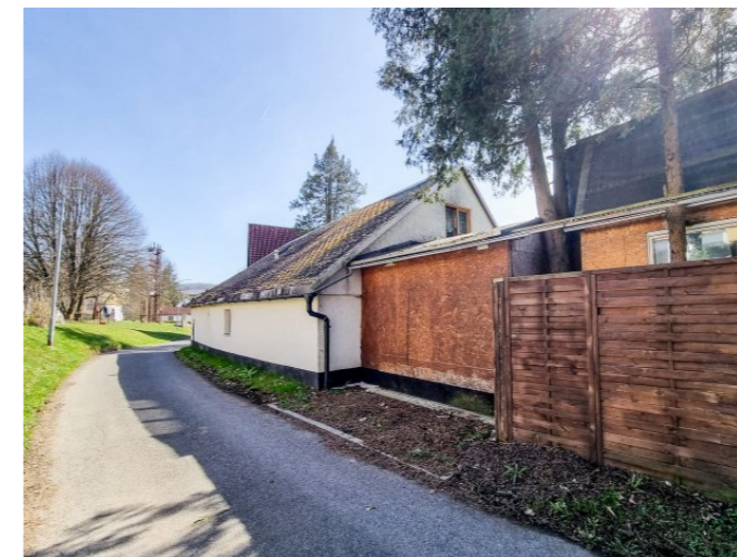
Vilémov č. p. 9 - Pohled na objekt ze severozápadu