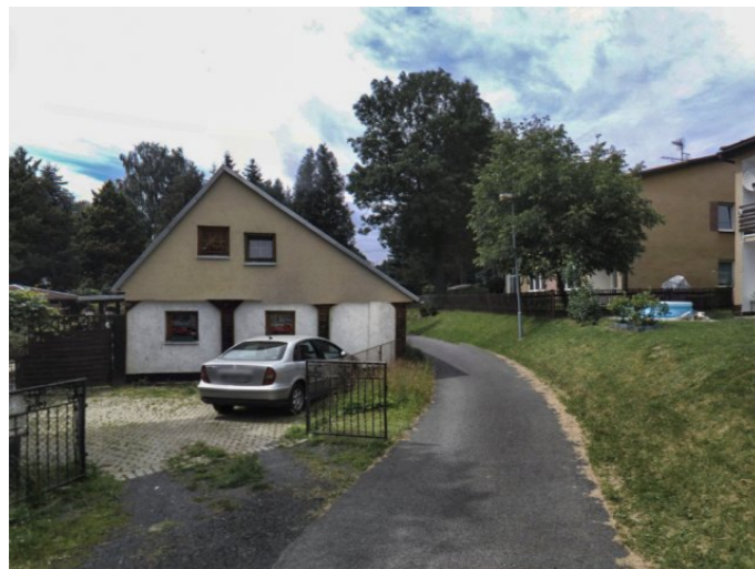
Vilémov č. p. 9 - Pohled na objekt z východu